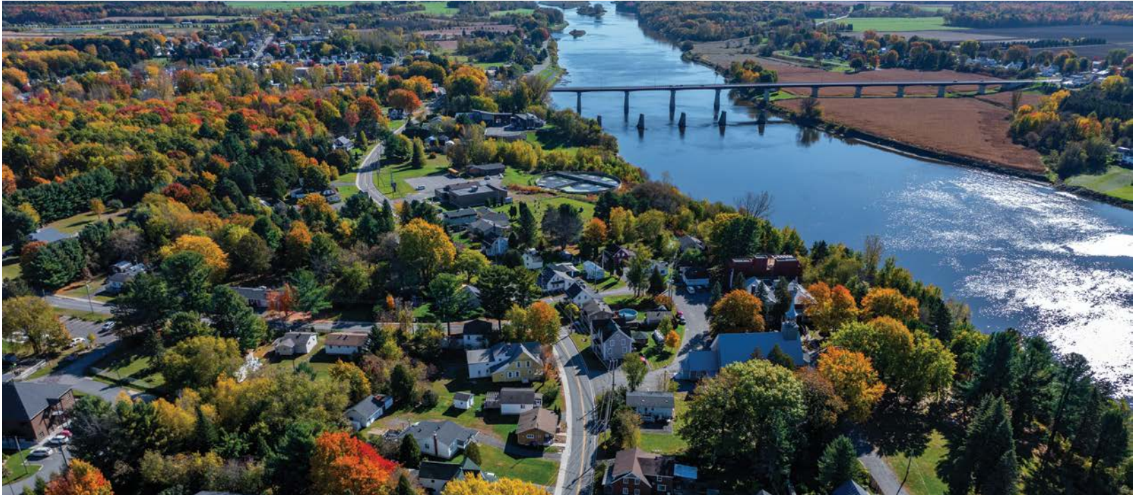
Vue aérienne de la communauté d'Odanak.