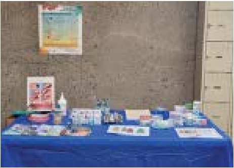
Un kiosque d'informations sur le programme Services Communautaires en Santé Buccodentaire (SCSB) lors de la journée de vaccination contre la grippe/covid était présent durant l'après-midi du 5 novembre.