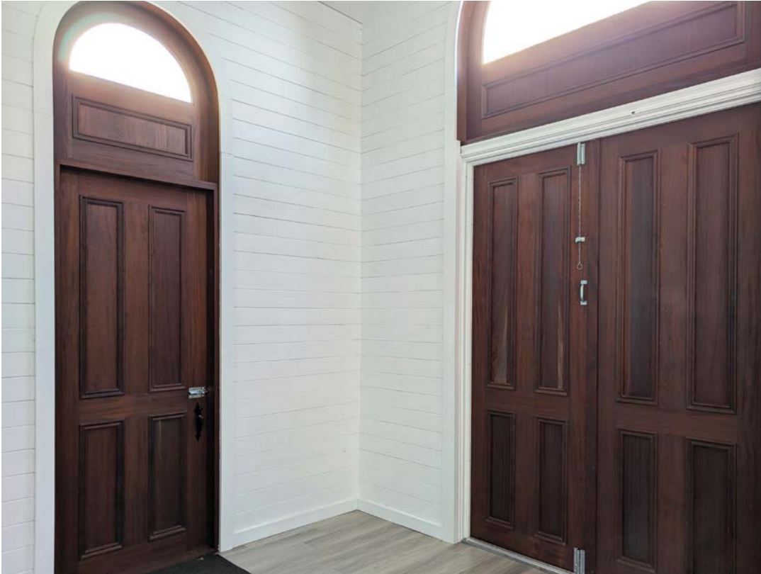
Nouvelles portes et portique rénové.