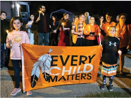
Vigile du 4 octobre.

Une vigile s’est tenue pour souligner la Journée nationale pour les Femmes assassinées et disparues, ainsi que l’attaque du Major Rodgers en 1759.