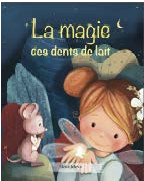
La distribution de livres d'histoire sur la santé buccodentaire, intitulés « La magie des dents de lait », a été faite chez les familles d'Odanak ». Ce livre aux illustrations magnifiques est très invitant pour en apprendre davantage sur les saines habitudes de soins, d'encourager la lecture et les moments en famille.