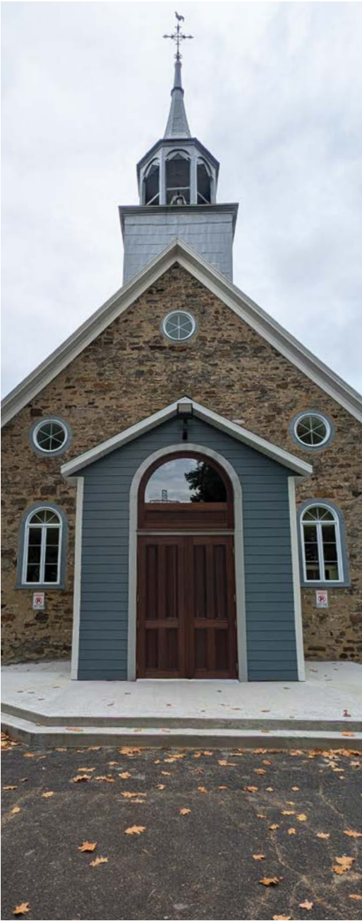
Nouvelles marches en béton.