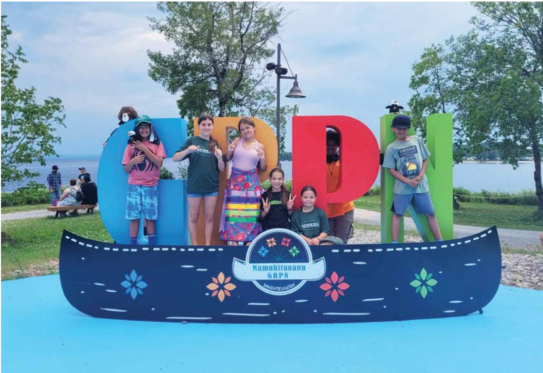
Initiation aux techniques de canotage au Parc national de la Mauricie le 9 et 10 juillet 2024.

Au-delà des connaissances acquises, ces moments partagés ont aussi été l'occasion de créer des souvenirs impérissables, de tisser des liens durables et de vivre des expériences à la fois joyeuses et formatrices. Si tu as entre 11 et 17 ans et que tu rêves de vivre des aventures culturelles aussi inspirantes, garde l'œil ouvert ! De nouvelles escapades seront proposées pour l'été 2025, et nous avons hâte de t'y retrouver !