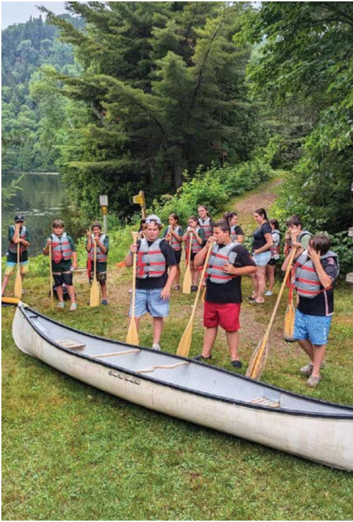
Sortie au Grand rassemblement des Premières Nations | Mamuhitunanu à Mashteuiatsh, le 12 et 13 juillet 2024.

Chaque année, cet événement lumineux devient un moment incontournable de la saison hivernale, une occasion de se rassembler et de célébrer ensemble la magie de l'hiver. Grâce à la beauté de cette installation, le sentier Tolba a offert un véritable voyage au cœur de la nature, illuminé par des milliers de lumières, créant une atmosphère chaleureuse et festive en plein cœur de l'hiver.